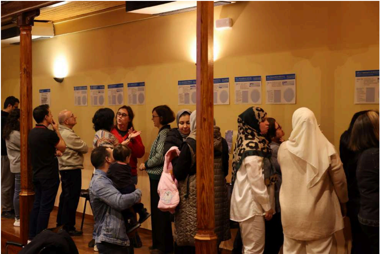
Imatge 9: Assistents participant de la dinàmica de validació i prioritització