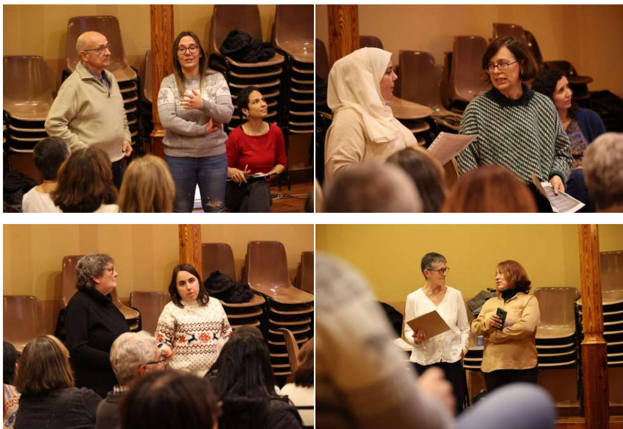
Imatge 7: Membres del Grup Arrel, persones tècniques de l'ajuntament i la regidora de participació presentant els eixos.