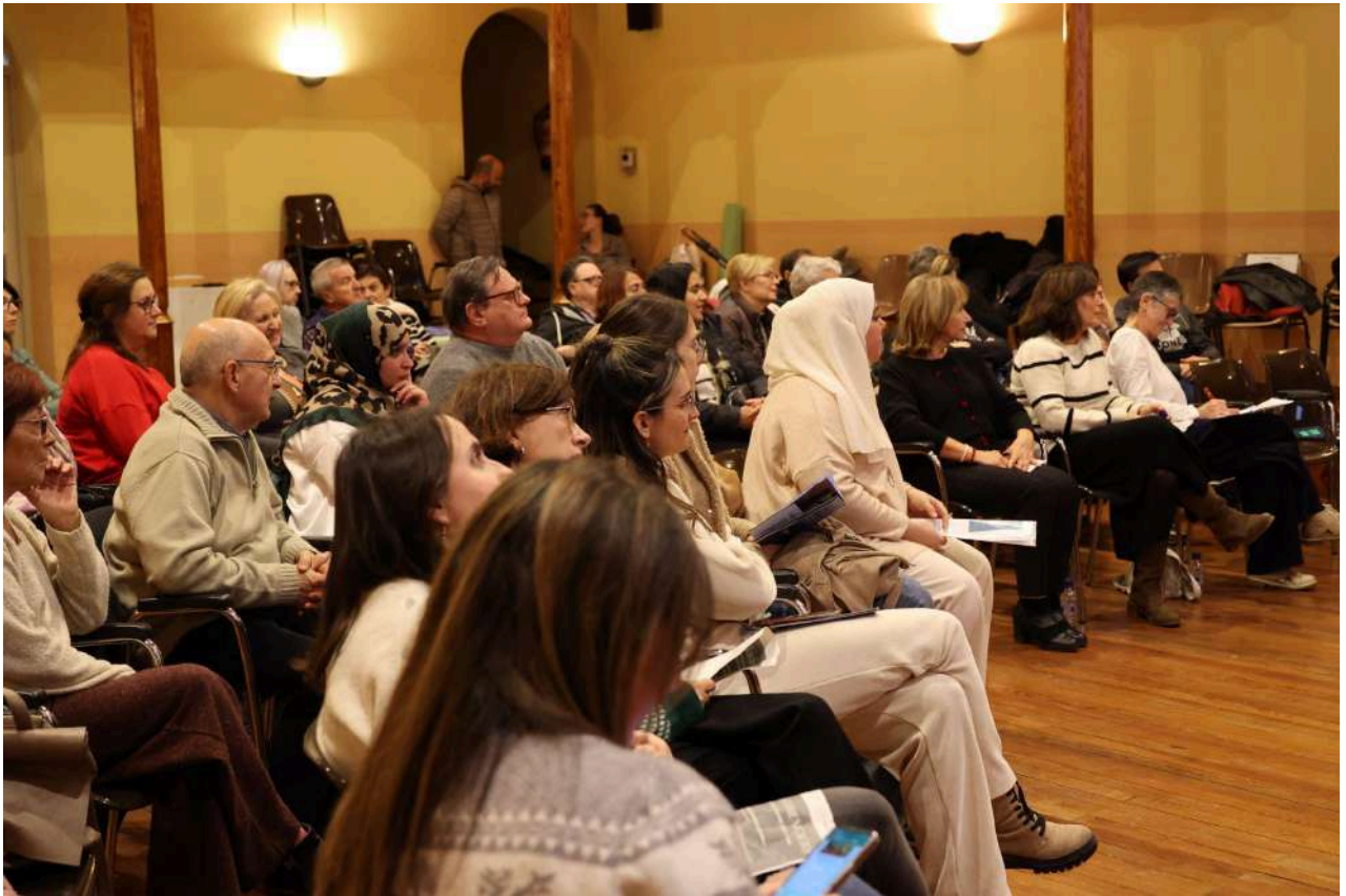
Imatge 10: Assistents durant la clausura de l'esdeveniment