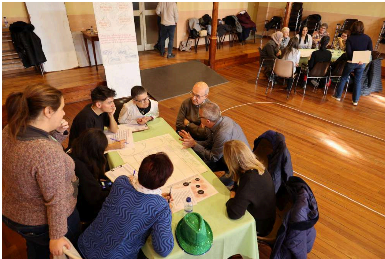
Imatge 4: Assistents a la jornada durant les taules sobre eixos, objectius i accions.