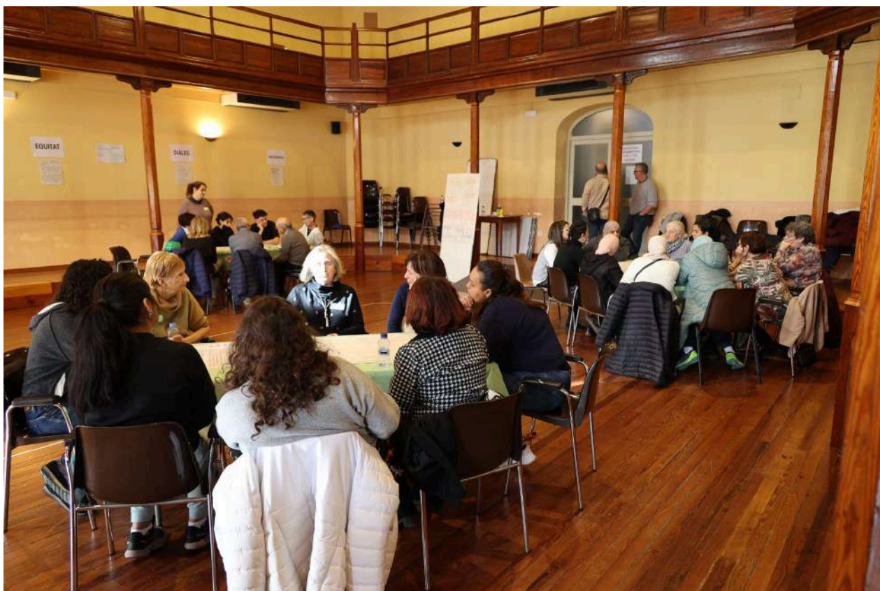
Imatge 2: Assistents a la jornada durant les taules sobre eixos, objectius i accions.

Un cop compartits i revisats els principis, el propòsit i els eixos, es va dividir la sala en els 4 eixos estratègics plantejats, per tal de revisar els objectius i el contingut i seguir afegint propostes d'accions. Les participants estaven convidades a canviar de taula cada 15 minuts per tal de pol·linitzar els diferents eixos amb informació recollida dels eixos de les altres taules. Finalment, els eixos, els objectius i les accions van quedar de la següent manera, recollida a les taules més avall.