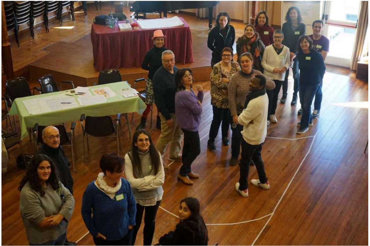
Imatge 3: Les persones posicionant-se segons el seu grau d'implicació a l'eix en qüestió