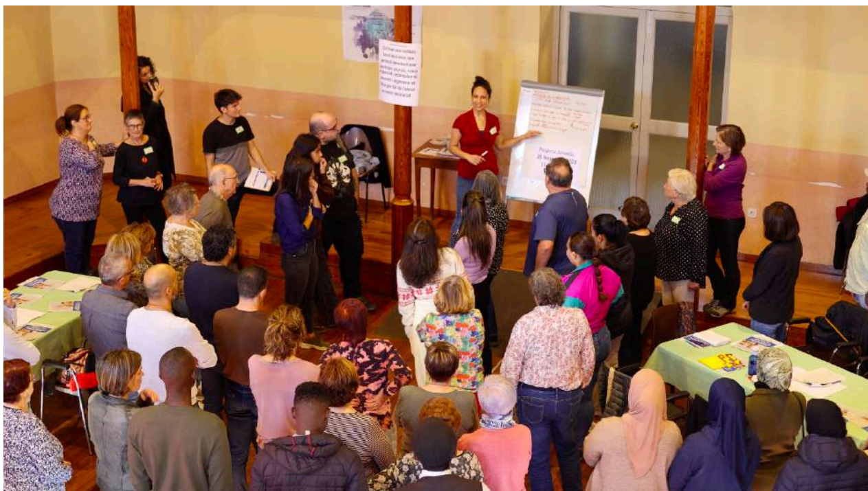
Imatge 2: La gent apropant-se al propòsit segons el seu grau d'acord amb la frase, amb la gran majoria posicionant-se entre 8 i 10.

Es va demanar que cadascú es col·loqués segons el grau d'acord que tenia amb el propòsit compartit, tot i que degut el gran nombre de participants, les participants es van haver de dispersar per la sala, però sempre mantinguen l'altura del seu grau consens corresponent a la línia dibuixada a terra.