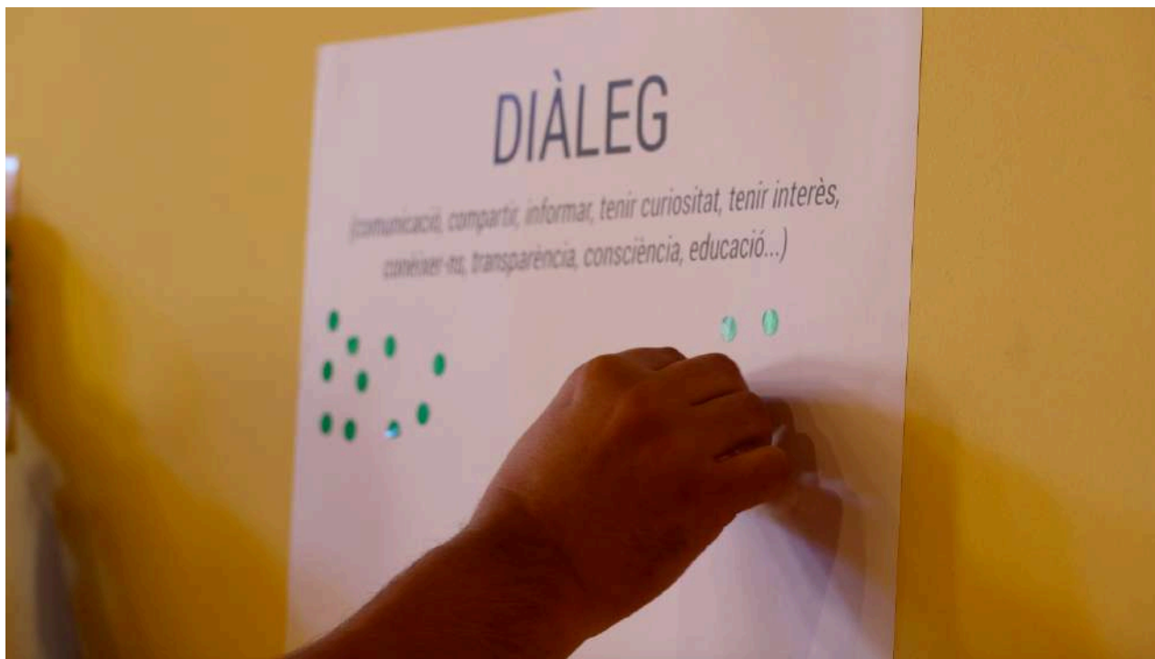
Imatge 3: Persona assistent participant de la dinàmica "gometocràcia".

Un cop recollides totes les intervencions sobre el propòsit es va presentar una proposta de 9 principis ètics de les quals un màxim de 5 marcaran el full de ruta del nou Pla de Ciutadania. Aquests principis sortien de les entrevistes i sessions comunitàries com les paraules regeneratives que més es repetien i prenen força.