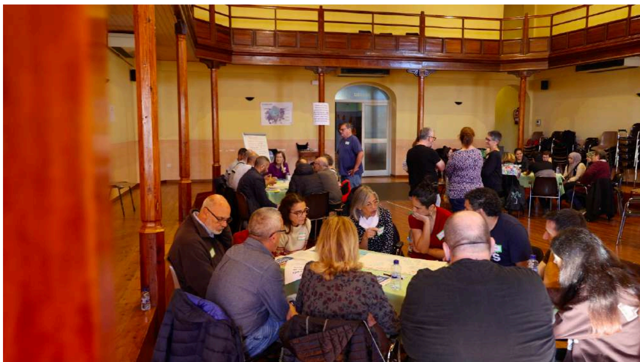
Imatge 4: Persones assistents participant de les diferents taules