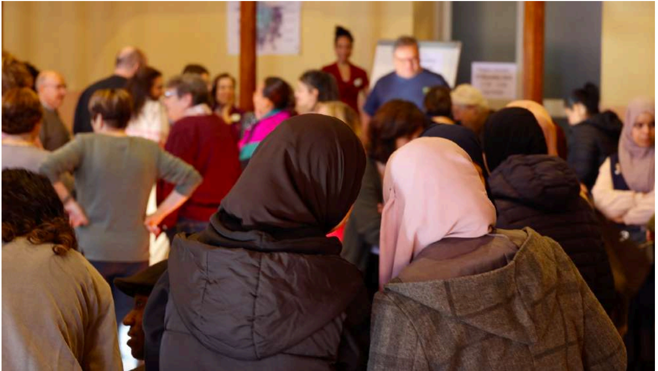
Imatge 6: Participants durant la jornada