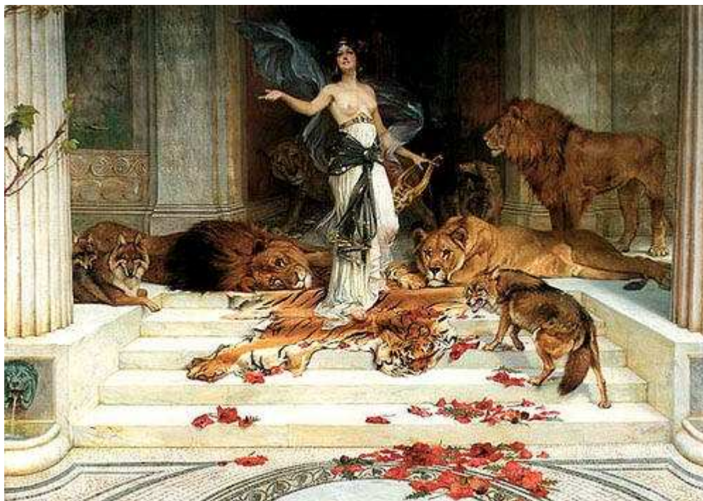
Representació gràfica de la maga Circe.