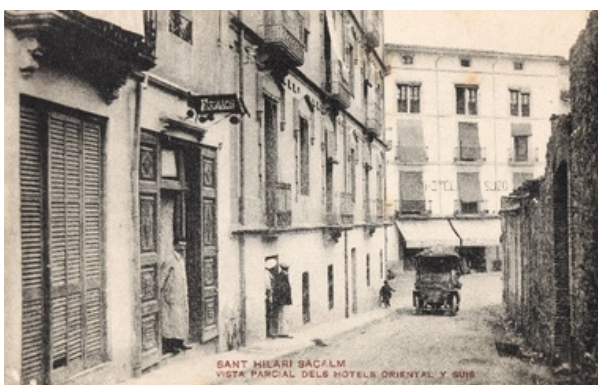
Fotografia de Sant Hilari el 1922

Naixia a principis d'estiu la Lliroia , un setmanari estiuenç que va tenir molt èxit amb onze números publicats el primer any i que tothom podia adquirir a l'emblemàtic establiment La Modernista. Hi trobem des de textos de personatges il·lustres com l'hilarienc Anton Busquets i Punset fins a publicitat amb les habitacions disponibles al poble o la llista de forasters que eren a Sant Hilari.