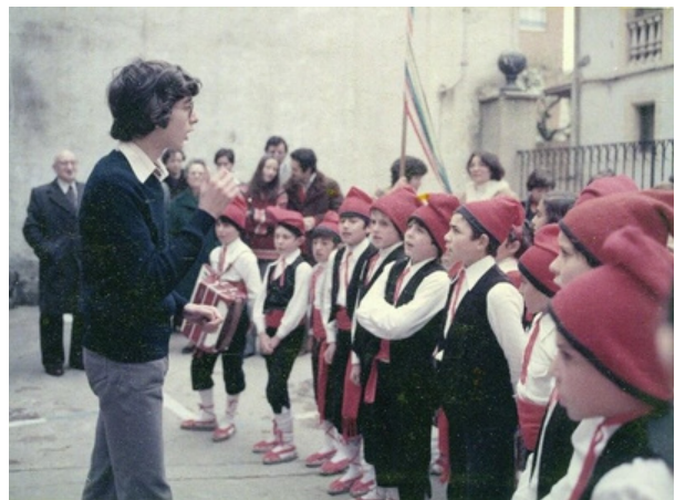
A l'esquerra, asfaltatge del carrer Rectoria el 1934. A la dreta, els Petits Cantaires davant l'Ajuntament el 1977.