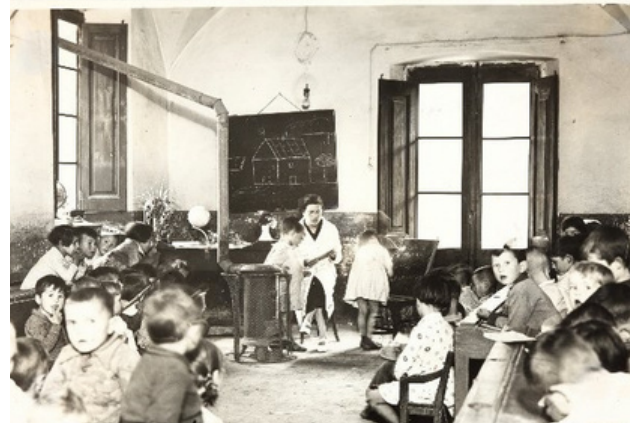
A l'esquerra, escales de l'església, carrer Rectoria i Hotel Fauria (Casa de la Mestra) el 1920. A la dreta, imatges de l'escola a l'edifici de l'Ajuntament a la dècada dels anys 30.

L'edifici on ara hi ha l'Ajuntament de Sant Hilari Sacalm ha tingut diferents usos al llarg de la història. Va ser hospital i també escola.