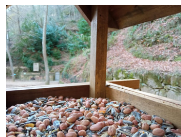
Caseta de la Biodiversitat a la Font Vella