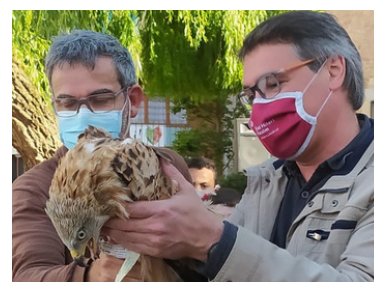
Alliberament d'un milà reial durant l'acte de presentació del Pla de Biodiversitat