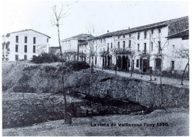
A l'esquerra, una fotografia actual. A la dreta, imatges antigues: una amb neu i l'altra abans de tancar la riera de Vallicrosa