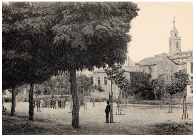
A l'esquerra, diada de Sant Jordi 2021. El poble es despertava amb tot de roses escampades fetes a mà. Va ser el regal de Sant Jordi per part d'una persona anònima. A dalt a la dreta, una foto amb el primer sortidor de La Placeta (1929) i a baix una foto encara més antiga

La riera de Vallicrosa, que podem veure a la foto de 1910, era un obstacle i calien obres i l'adquisició de terrenys privats per acabar d'enllestir la plaça. El 1912 es van tapar les clavegueres del carrer Hort Nou i de la Placeta, per una epidèmia de còlera, i després les obres van quedar encallades durant una bona temporada.