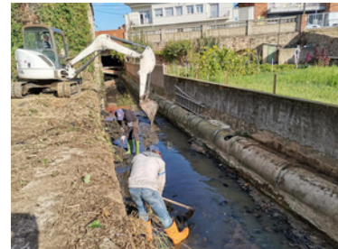
Tasques de neteja al Torrent d'en Serres a l'octubre del 2021