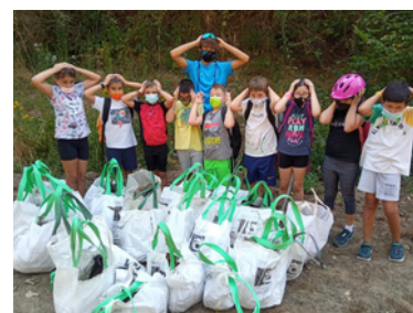
Jornades de neteja Let's Clean Up amb les escoles