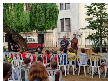
Presentació del Pla de Biodiversitat