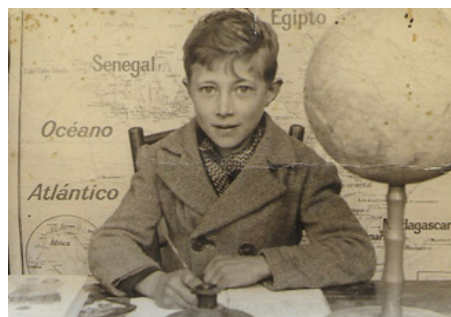
De petit anava a estudi a la Rectoria