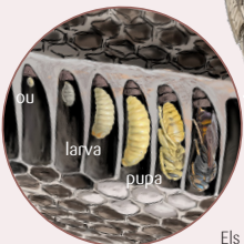
Els vespers apareixen il·lustrats a escala decreixent a mesura que avança el cicle anual.

Dels ous postos per la reina en cel·les individuals, en neixen larves que passaran per cinc estadis de creixement fins a assolir l'estadi de pupa i, finalment, d'adult.