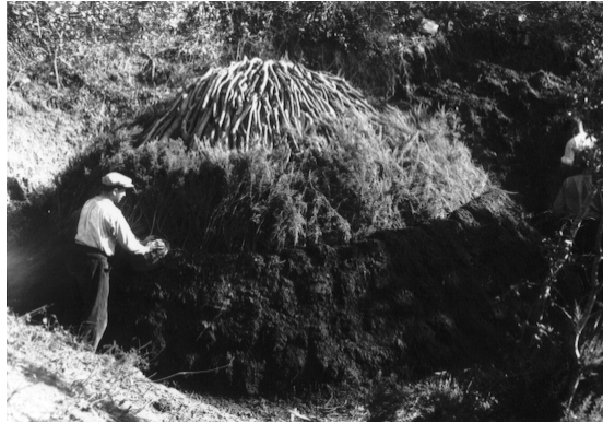
un carboner acabant de construir una pila

Un cop fet això la tallaven a mida, que sovint oscil·lava un metre i mig de llargada. Després feien una pila i per embolicar-la feien servir les mateixes branques de l'arbre, en especial l'alzina. Sobre això col·locaven una capa de sorra, que ho cobria tot, com veiem en la següent foto.