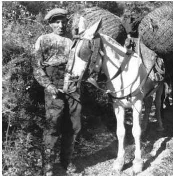
un matxo carregat amb el carbó a les sàrries

Després treien el carbó amb l'ajuda de l'aixada i els rampins. Com que la pila es podia encendre, amb la mateixa sorra que treien la cobrien una altra vegada per apagar el foc si n'hi havia. Llavors estenien a terra el carbó obtingut i el deixaven refredar. Un cop fred el col·locaven en sàrries, cada una de seixanta-cinc quilos, les quals eren carregades sobre els animals i portades fins als destins corresponents. La producció que havien aconseguit podia oscil·lar entre quinze i cent cinquanta cargues de carbó, que era igual a entre cent vint i cent vint-i-cinc quilos d'aquest mateix.