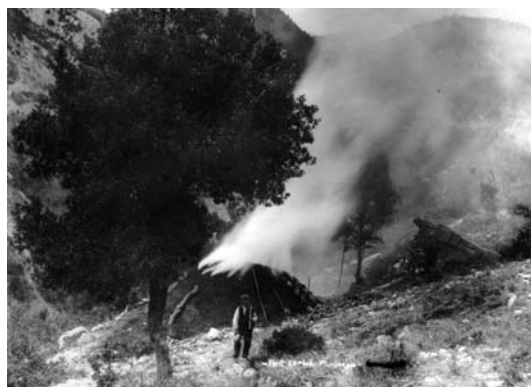
una pila cremant, en plena acció

Seguidament procuraven deixar un forat al mig de la pila, per tant un espai vertical que per posar-hi llenya i així fer que el foc la cremés i en canvi no cremés la pila. Aquesta acció la feien cada matí i cada vespre i popularment es coneix amb el nom de bitllar la pila. D'aquesta manera la pila anava cremant la llenya i s'anava formant el carbó. Cal dir també que li feien uns petits forats per tal de dirigir el sentit en que el foc havia de cremar. Si havia de cremar més la part esquerra de la pila, feien els forats a la dreta, i al revés. El procés de carbonització havia de ser perfectament conegut i assimilat pel carboner, i sabia en quin estat es trobava per mitjà de les olors i colors del fum que anava desprenent. Observem una pila en plena acció.