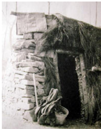
una cabanya dels carboners, allà on s'aixoplugaven durant l'estada al bosc

Una vegada vist el procés de la fabricació de carbó, anem a veure què comportava fer aquest ofici. La vida dels carboners es desenvolupava al mateix bosc on era construïda la seva barraca, mentre durava el procés de combustió de la pila de carbó, ja que calia anar-la mantenint i vigilant. Veiem una barraca de carboner.