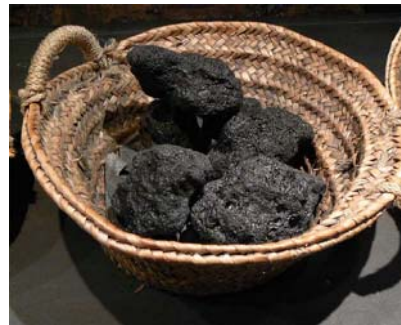
una sàrria amb trossos de carbó

Una vegada vist el procés de la fabricació de carbó, anem a veure què comportava fer aquest ofici. La vida dels carboners es desenvolupava al mateix bosc on era construïda la seva barraca, mentre durava el procés de combustió de la pila de carbó, ja que calia anar-la mantenint i vigilant. Veiem una barraca de carboner.