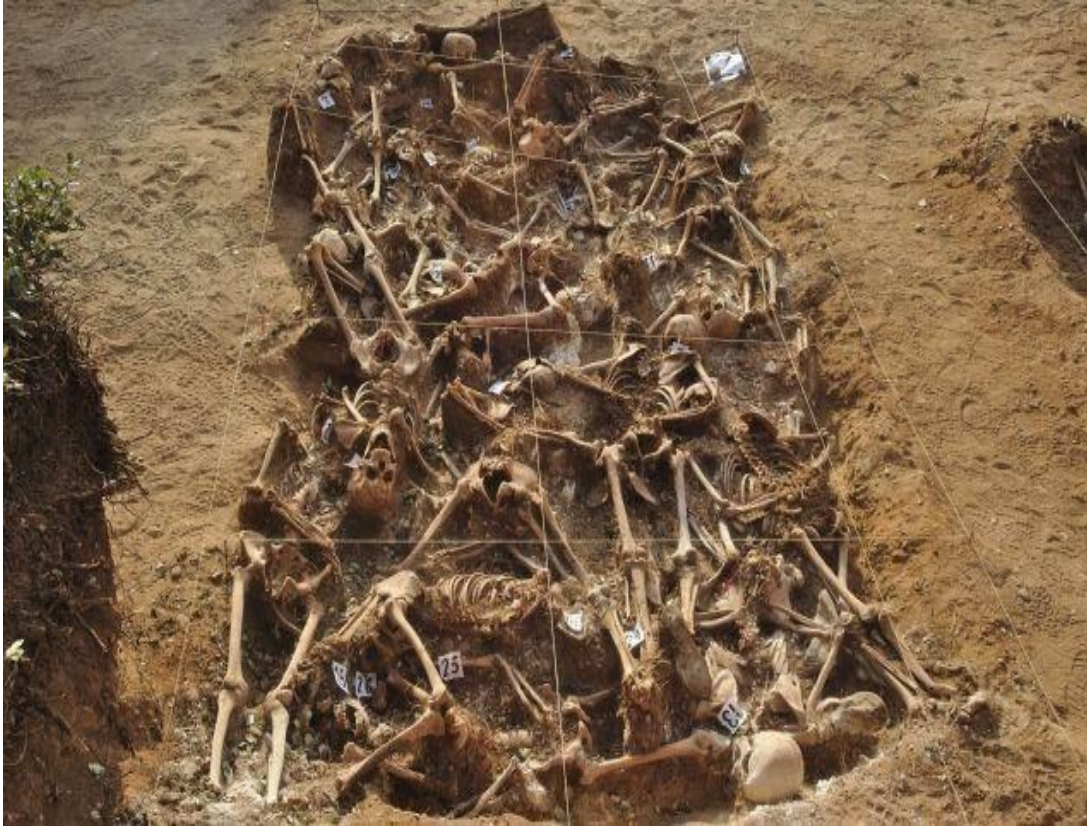
Fossa comuna descoberta a Estépar (Burgos), amb 26 republicans assassinats pels nacionals a l'inici de la Guerra Civil (1936)