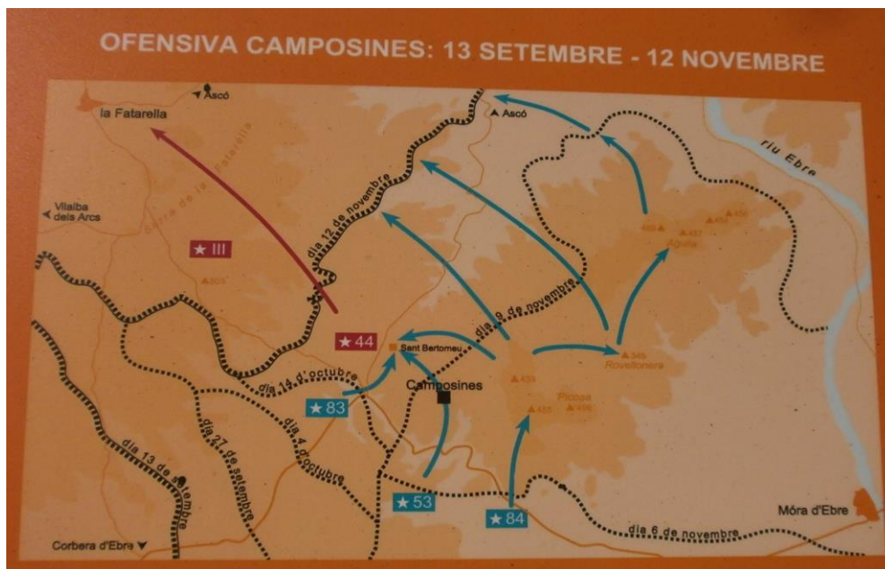
Memorial de les Camposines (font pròpia)

El lloc on s'ha construït aquest Memorial fou l'objectiu de tres ofensives de l'exèrcit franquista sobre les forces republicanes per tal de forçar la seva retirada. Durant 90 dies de durs combats les forces republicanes van resistir sense recular, gràcies a la vida de nois molt joves cridats a defensar la República amb les seves vides. Allà van desaparèixer molts d'ells i no se'n sap el final. Aquest lloc va ser arrasat per les tropes franquistes.