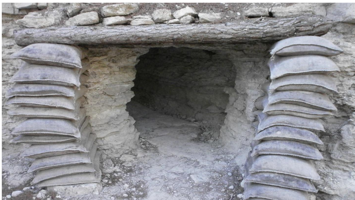
Trinxera Batalla de l'Ebre. Espai del Memorial de les Camposines