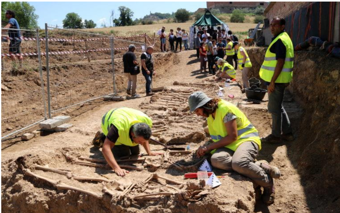
Fossa de Figuerola d'Orcau, al Pallars Jussà, exhumada el juny del 2017.

https://www.vilaweb.cat/noticies/milers-victimes-guerra-1936-1939-continuen-fosses-comunes-vuitanta-anys-despres/