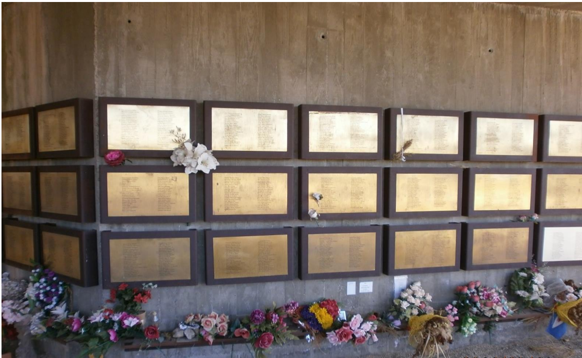
Memorial de les Camposines. Plaques amb noms de 1544 víctimes inscrites

El lloc on s'ha construït aquest Memorial fou l'objectiu de tres ofensives de l'exèrcit franquista sobre les forces republicanes per tal de forçar la seva retirada. Durant 90 dies de durs combats les forces republicanes van resistir sense recular, gràcies a la vida de nois molt joves cridats a defensar la República amb les seves vides. Allà van desaparèixer molts d'ells i no se'n sap el final. Aquest lloc va ser arrasat per les tropes franquistes.