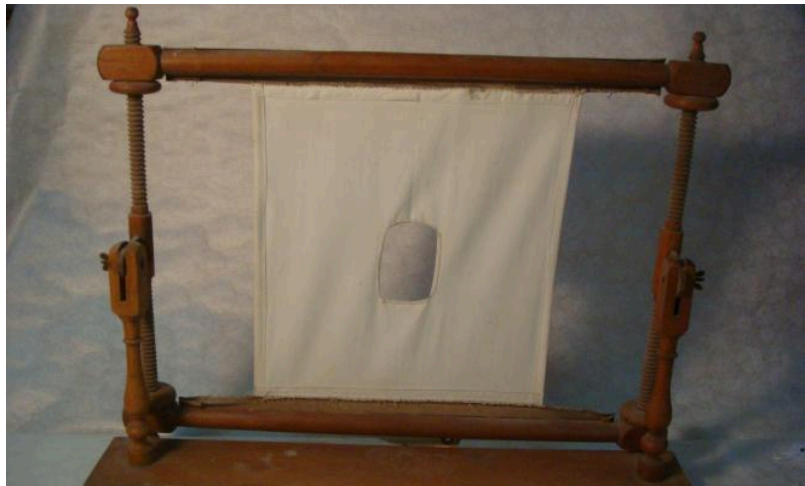
Teler de brodar, museu de Tavertet

Les habilitats que tenien aquests artesans eren molt importants i interessants. I en haver-hi uns oficis tan distints i concrets provocava que els coneixements de cada treball fossin molt diferents a qualsevol altre. És per això, que s'han anat perdent totes aquestes habilitats i seria molt complicat recuperar-les. En tot cas, no seria exactament igual que com ho feien aquelles persones.