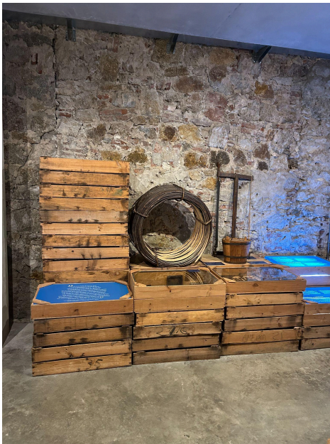
Botes i Rodells, Museu de pesca de Palamós

Els oficis perduts tenen en comú que, la majoria per no dir tots, van ser substituïts per màquines que feien la mateixa feina però el doble de ràpid i amb menys costos. Ja veiem que això passava abans, què ens passarà ara que els robots també ho podrien fer tot i que existeix la Intel·ligència Artificial? Bé, doncs el que els va passar durant aquest segle s'anomena industrialització.