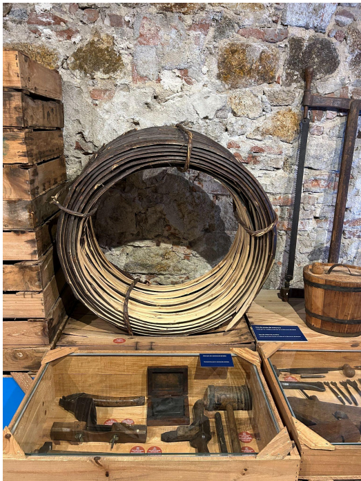
Rodell, Museu de Palamós.

Des del torner fins al sereno eren uns oficis que s'han perdut degut a la industrialització i la globalització. Vam passar d'una economia de subsistència a una economia comercial. Es va deixar de produir per sobreviure i es va començar a produir per vendre els productes i guanyar diners. Això va provocar un canvi dràstic en la societat.