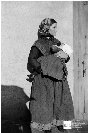
Dona alletant a un infant. Barcelona, 1880-1900.

La principal font d'ingressos de totes aquestes persones de les que hem parlat, depenien de la demanda i del nombre de clients que tenien. Però hem d'entendre que no era comú fer exportacions pels artesans. Doncs la seva subsistència requeia en el nombre de clients habituals del poble o voltants i la seva fama. Clar que si eres més conegut podries prosperar més i finalment obrir-te més cap al país. 2