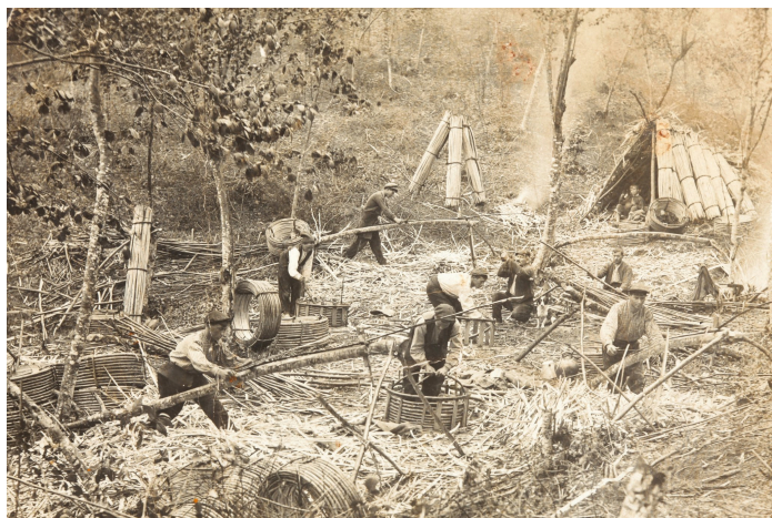
Roders treballant fent els cèsclcs.