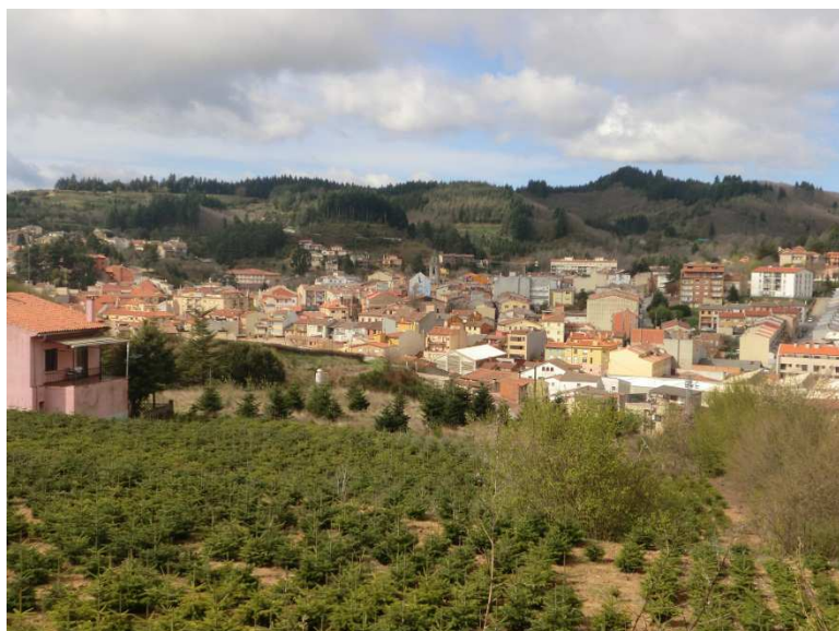
Pujada Carrer Hospital- Mas Garriga

Sant Hilari és un poble que ha vist que les seves diferents indústries s'han anat reduint, la torneria gairebé ha desaparegut, l'aigua està sotmesa a nous canvis, el comerç depèn de la indústria del poble i aquesta cada vegada és més reduïda. Tenim un sector dels viviers, que a diferència dels altres sectors,