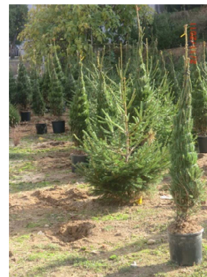
Arrencar i entestar

És el període més costós, es fa tot a través de personal especialitzat i de forma manual. En aquesta època és quan es contracta més personal temporal.