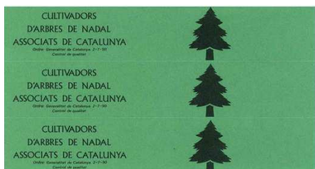
Etiquetes de l'Associació d'Arbres de Nadal

A més a més, a Catalunya hi ha l'obligació de posar una etiqueta verda com a simbologia de ser un arbre cultivat. Fora de Catalunya, aquesta obligació no existeix. Aquesta etiqueta verda pot ser personalitzada (de cada viver) o generalitzada per l'Associació d'Arbres de Nadal.