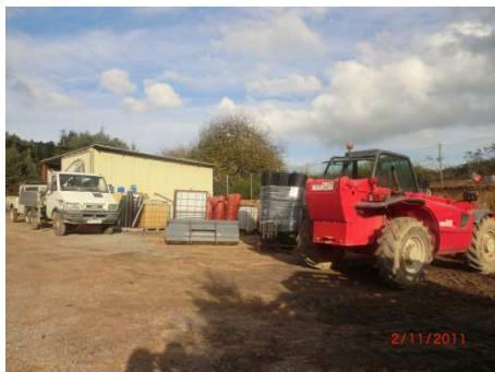
Viver a Sant Hilari

L'arbre de Nadal es podria considerar com un producte dins de les plantacions de viveristes, però a la zona de Sant Hilari-Guillerics s'ha aconseguit uns nivells de producció que es podrien considerar com a una indústria independent del sector de les plantes vives. És una producció totalment de temporada que dona feina durant els mesos de setembre a març.