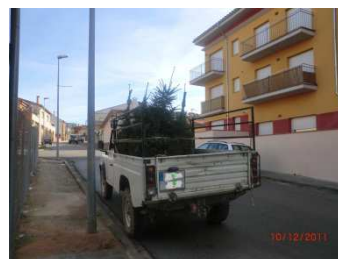
Transport de l'arbre pel poble

La venta d'aquests arbres es realitza majoritàriament a través de majoristes i garden centers . També es fa a través de fires sent la més famosa de les nostres contrades, la Fira d'Espinelves. No s'opta per la venta minorista pel gran