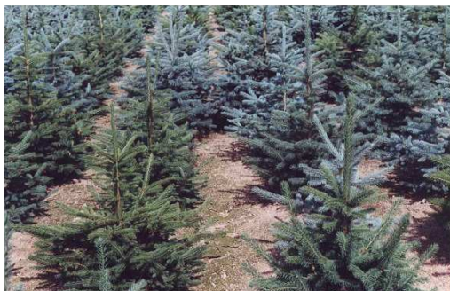
Picea Excelsa i Pungens Glauca

Bàsicament tots són similars; la diferencia és la textura, el color i la densitat de les seves fulles. Acompanyem les fotografies de les diferents espècies per poder distingir cada una. Les edats de comercialització dels arbres són a partir dels quatre a dotze anys.