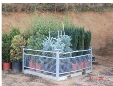
Transport de l'arbre