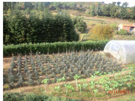
Viver a Sant Hilari

vacances i viatjar. Arran dels grans índex d'atur i la crisi, molta gent s'ha quedat sense recursos per fer aquestes festes i viatges. Han optat per celebrar les festes a casa seu i comprant arbres de Nadal naturals per fer-les més joioses. “Ja que no podem sortir almenys fem la festa a casa” aquesta postura ha fet que molta gent que no comprava arbres de Nadal ara en compri un com a un extra.