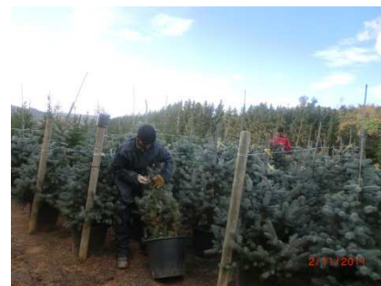
Procés de lligar l'arbre

També es fa de forma manual a través de personal especialitzat.