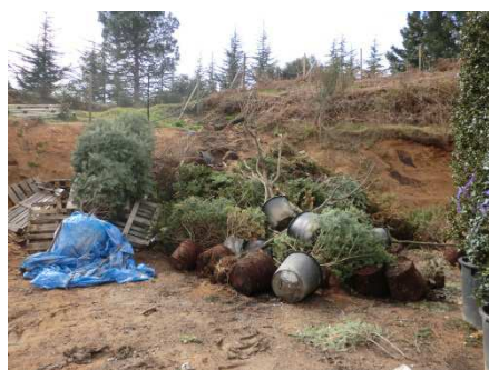
Residus en un viver hilarienc

En el procés d'arrencar es destrueixen varis arbres i en el procés de comercialització