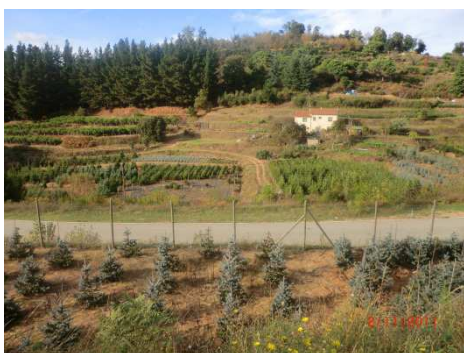
Plantació d'arbres de Nadal

És el període en el qual l'arbre creix. Tal com he dit anteriorment aquest procés pot durar entre quatre i dotze anys. L'únic que es fa és mantenir els camps nets d'herbes i cada dos anys es fa una poda bàsica per aconseguir que els arbres tinguin la forma piramidal. En zones de molta sequera es pot optar pel reg artificial, però a Sant Hilari massivament és l'aigua de les pluges qui rega les plantes.