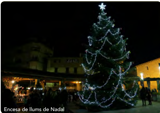
Encesa de llums de Nadal