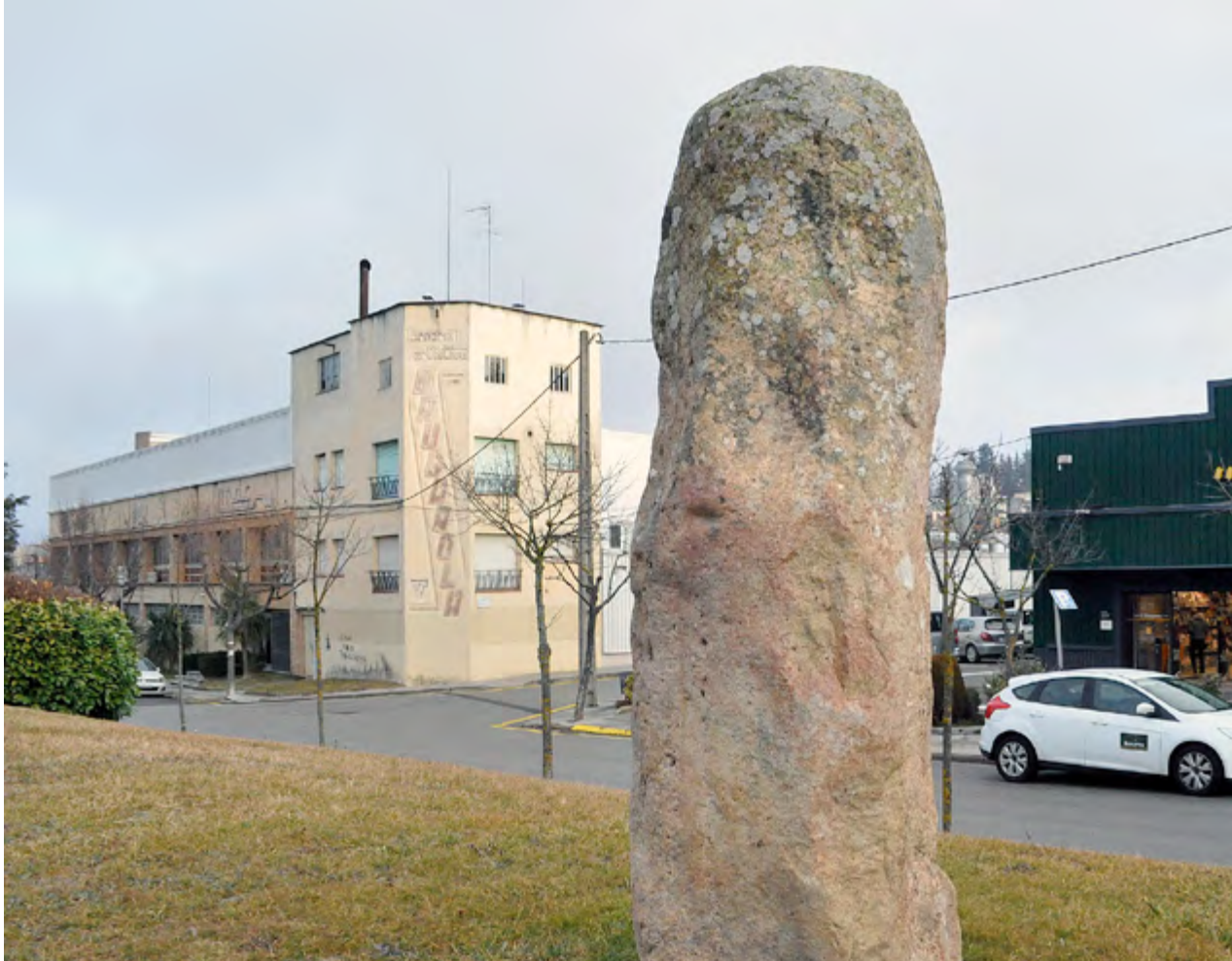
Autor, SALVADOR BOSCH Data, gener de 2018 Lloc, entrada del poble, crtra. d'Arbúcies