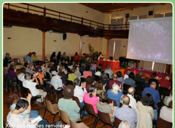
Xerrada herbes remeieres