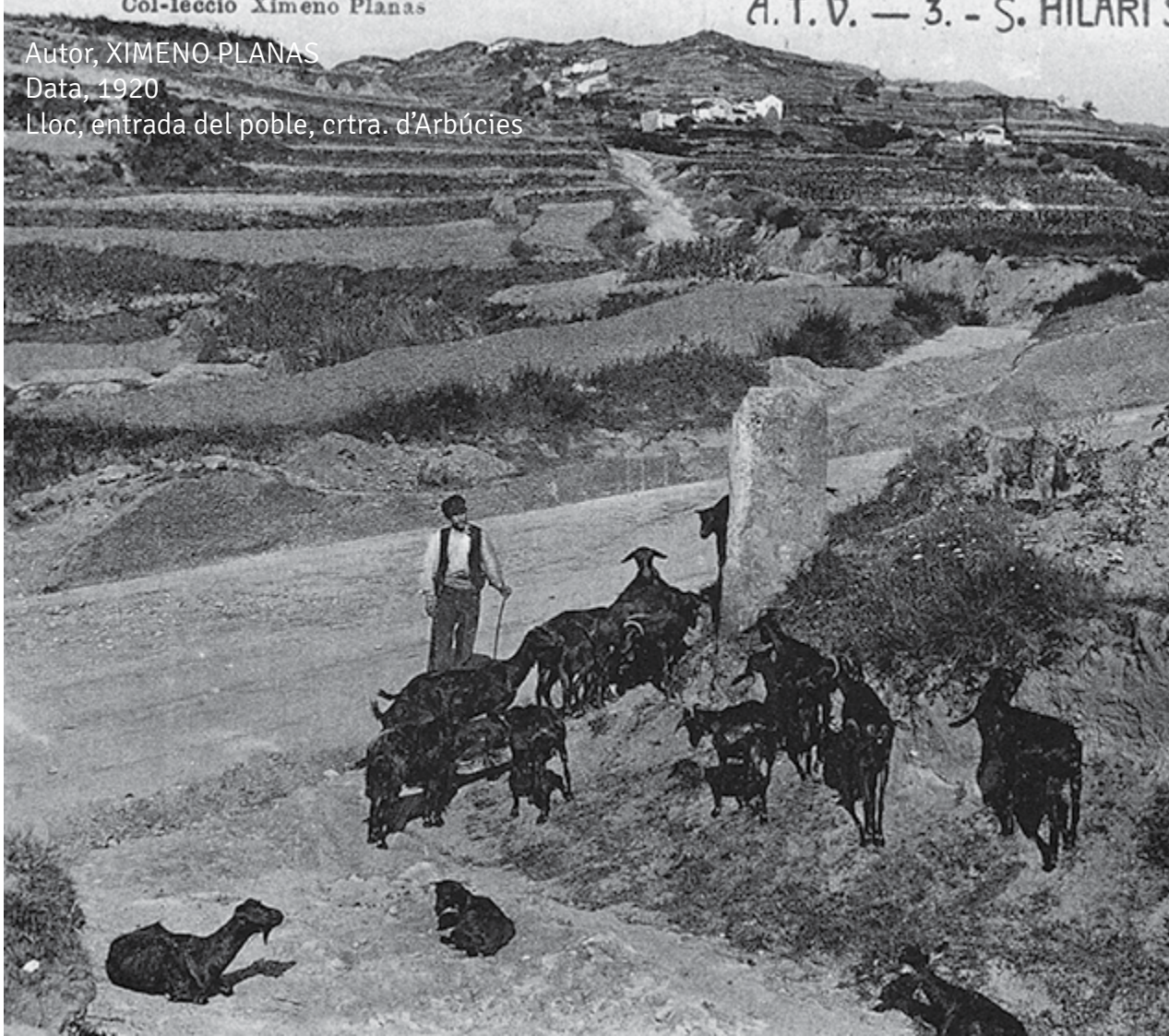
Autor, XIMENO PLANAS Data, 1920 Lloc, entrada del poble, crtra. d'Arbúcies