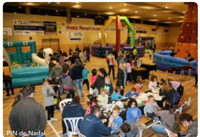
PIN de Nadal