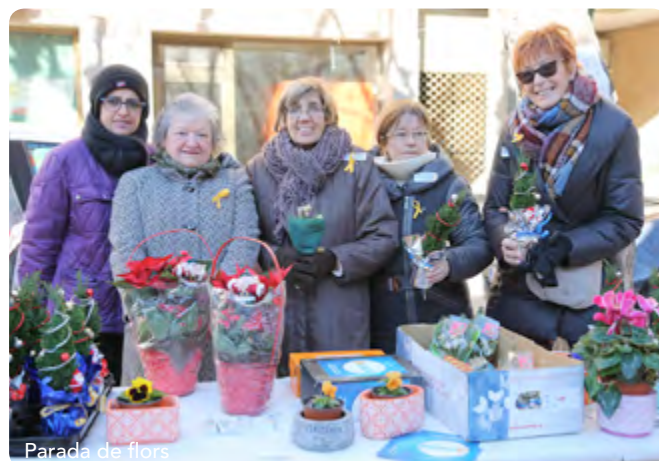
Parada de flors