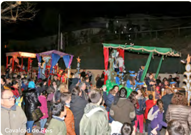
Cavalcad de Reis

Com cada any, l'encesa de l'arbre de Nadal, els tallers familiars i la pluja de globus van donar el tret de sortida de les festes de Nadal. Un munt d'activitats ens han acompanyat durant aquests dies. Els petits de fins a 12 anys han pogut gaudir un cop més del Parc Infantil de Nadal al Pavelló Municipal d'Esports amb els inflables, rocòdrom, zona de contes...etc. A més, els concerts de Nadal, el Festival de Patinatge del Col·legi Sant Josep i les activitats esportives i solidàries ens han fet gaudir aquests dies. El dia 24 vam fer cagar el tió a la Sala Noble després de gaudir d'un espectacle musical i d'entreteniment sobre les llegendes nadal·lenques. Per fi, el dia 5 de gener, van arribar els tres reis de l'Orient!