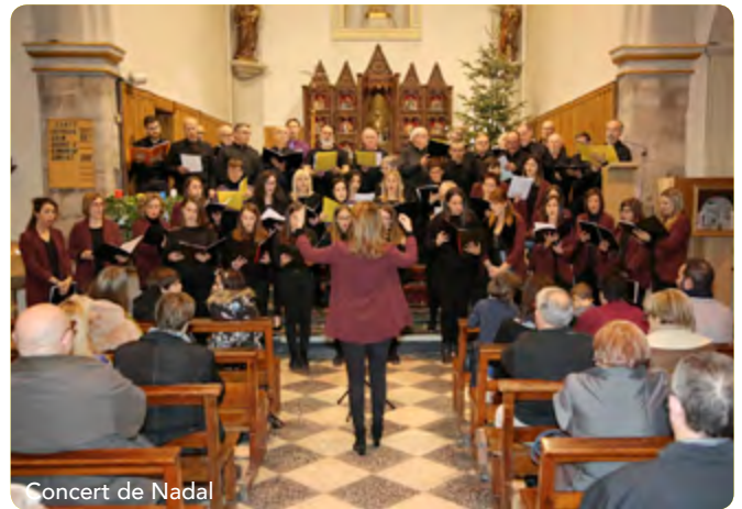
Concert de Nadal