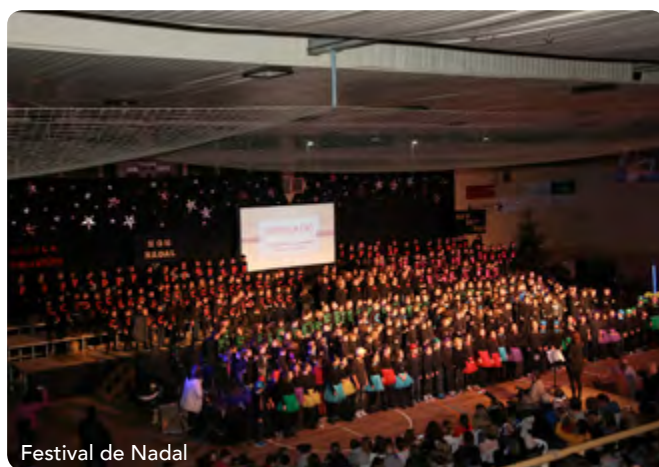
Festival de Nadal