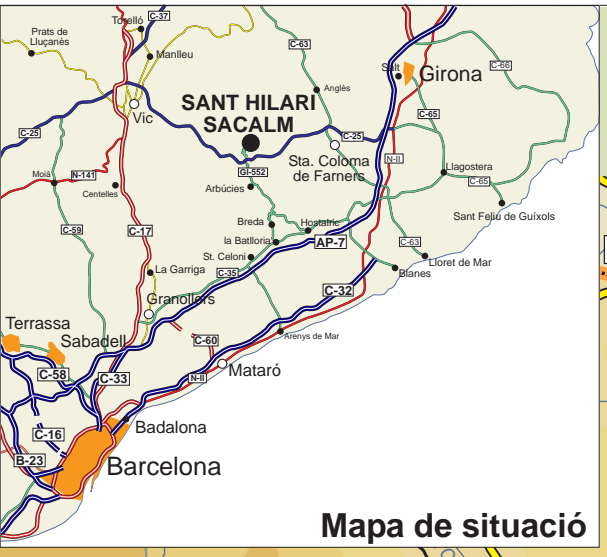
Mapa de situació