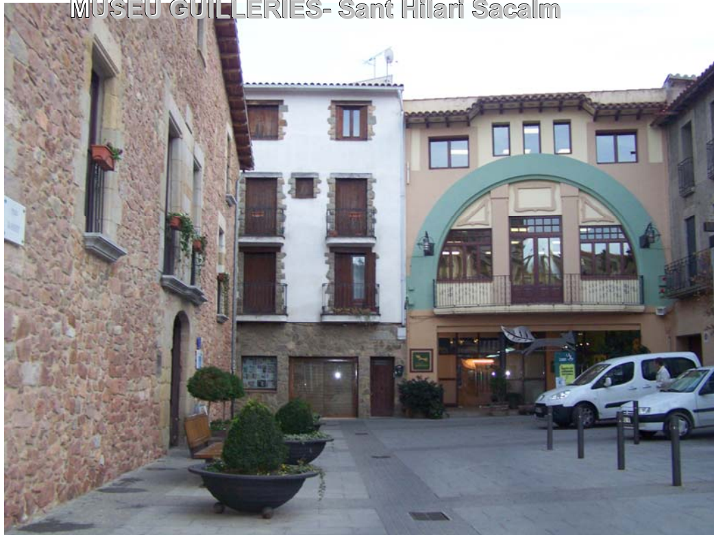
Edifici de la Cooperativa i can Rovira

La visita al museu Guillerries conforma una unitat de dos edificis emblemàtics del Patrimoni de Sant Hilari Sacalm. Aquests dos edificis es troben ubicats a la plaça Doctor Robert al mig del casc antic del poble.