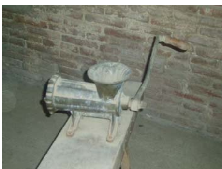
Màquina de trinxar carn antiga

En aquesta foto podem observar l'antiga màquina de trinxar la carn i també de fer les botifarres, gràcies a una altra peça que s'hi pot afegir. El seu funcionament és molt senzill, s'introdueix la carn pel forat superior, es fa girar la maneta i la carn trinxada surt per la part del davant on s'hi troben uns petits foradets.