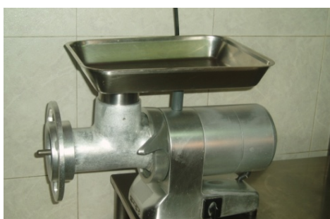
Màquina de trinxar carn

En aquesta foto podem observar l'antiga màquina de trinxar la carn i també de fer les botifarres, gràcies a una altra peça que s'hi pot afegir. El seu funcionament és molt senzill, s'introdueix la carn pel forat superior, es fa girar la maneta i la carn trinxada surt per la part del davant on s'hi troben uns petits foradets.