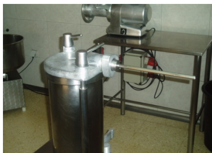
Màquina de fer embotits

Aquesta màquina és el resultat de l'evolució de l'anterior. El funcionament és pràcticament igual, l'única cosa que canvia és que funciona automàticament. Es posa la carn que es vol trinxar a la part de sobre, on s'hi troba un orifici per on baixa la carn, la trinxa i surt pels petits forats que hi ha a l'esquerra de la fotografia.